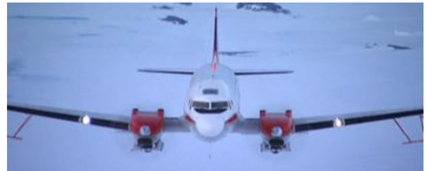
ATR 42 - 500